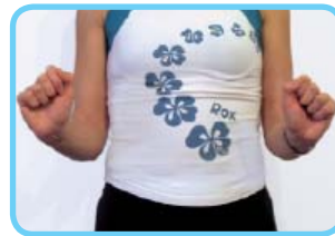
Mover os pulsos facendo círculos cara a ambos lados.