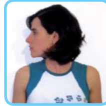
Mover a cabeza suavemente, de fronte-abaixo, de lado a lado, etc.